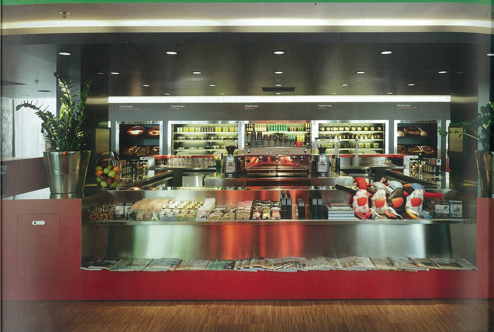
canteenM, een combinatie van bar en zelfbedieningsrestaurant.