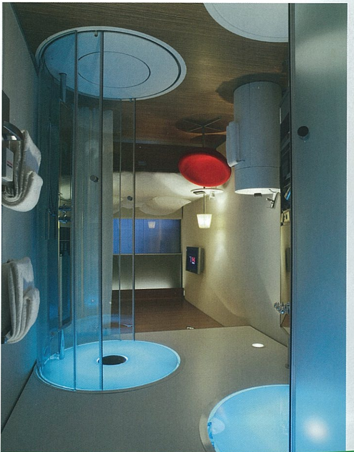
Douche en toilet bevinden zich in transparante zuilen, de wastafelzuil en douchebodem zijn gemaakt van corian.