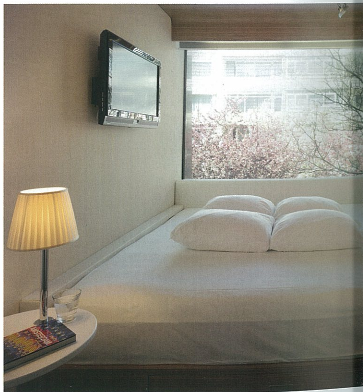
>> Compacte hotelkamer met kingsize bed en kamerbreed raam.

De 215 hotelkamers hoeven niet groot te zijn, want op de begane grond is het goed toeven in de lichte T-vormige lobby, een waar