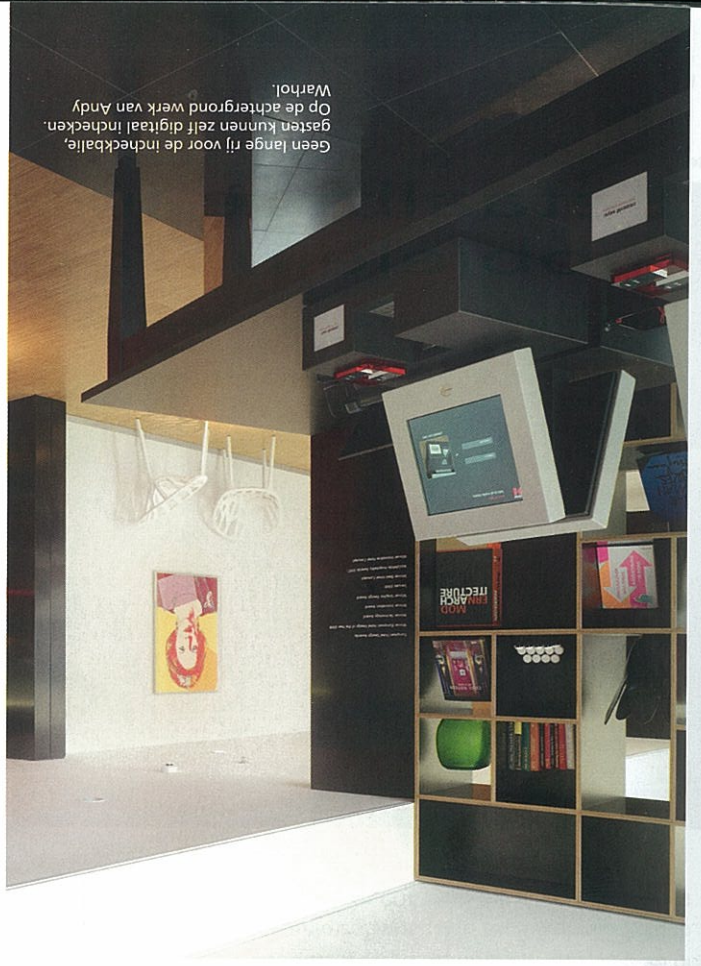
Geen lange rij voor de incheckbalie, gasten kunnen zelf digitaal inchecken. Warhol. Op de achtergrond werk van Andy