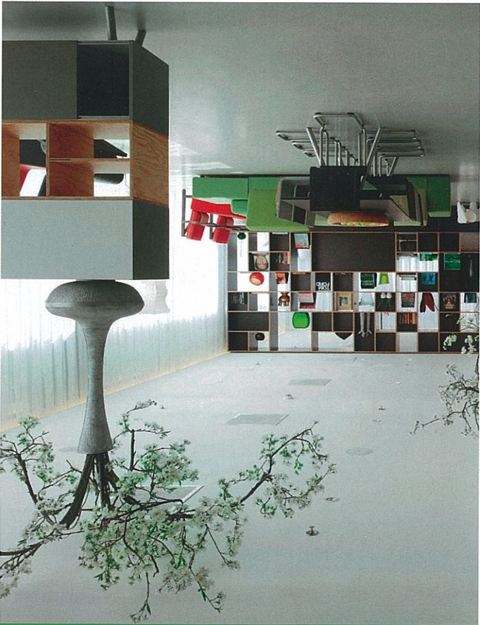
De lichte lobby, onderverdeeld in verschillende 'huiskamers'.

luilekkerland voor designliefhebbers. De hele ruimte is door semi-open kastenwanden verdeeld in verschillende huiskamers, ingericht met meubilair van Vitra; van designklassiekers als de Eames Lounge Chair en de Marshmallow Sofa van George Nelson tot de nieuwste stoelen van de Bouroullec-broers. Het is een typisch voorbeeld van de kruisbestuiving waar ze bij CitizenM zo dol op zijn. Wagemans: "Vitra was op zoek naar een manier om hun producten op een toegankelijke manier onder de aandacht van het publiek te brengen, en wij vinden het leuk om in onze hotels meubels te gebruiken die je mooi vindt maar niet zo snel voor thuis aan zult schaffen." En zo kan het dus gebeuren dat je 's ochtends met je crossantje plaatsneemt op de poldersofa van Hella Jongerius, om na het ontbijt een zakenbespreking te houden in het formelere deel van de lobby, ingericht met designklassiekers als de Eames Aluminium Chair. Wie wil werken kan plaatsnemen op een witte Eames barstoel aan de lange bar en zijn computer inpluggen. "We willen mensen met deze ruimte de gelegenheid bieden met elkaar in contact te komen," aldus Chadha.